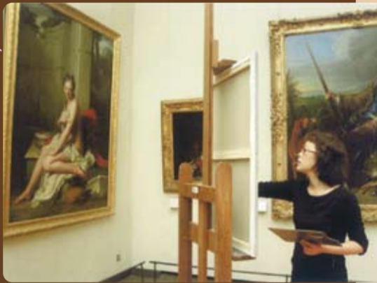
フランス・ルーブル美術館にて

ヨーロッパに影響をもたらせたオーストリア王宮文化。皇后マリアテレジアの娘マリアアントワネットが嫁いだフランス・パリより若手女性画家のクリスマスカードが届きました。素敵なカードを大切な方に贈りませんか?