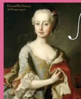
皇女時代のマリア・テレジア(部分) マルタン・ヴァン・メイテンスの工画 油彩、カンヴァス 1730年頃