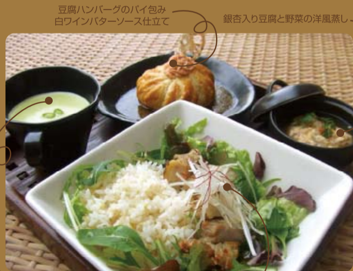
豆腐ハンバーグのバイ包み 白ワインバターソース仕立て