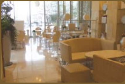
キャラメルをイメージしたシマシマの壁に囲まれた店内。 あたたかみのある天然石と手づくりのインテリアがカワイイ!