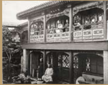
官僚の邸宅(北京)、ジョン・トムソン 1871-2年頃 東京富士美術館蔵

東京富士美術館では現在、新館・常設展示室7で、館蔵品展「異邦人の眼差し—清朝末期の北京 ジョン・トムソンほか」を前期後期に分けて開催している。スコットランド出身の写真家、ジョン・トムソン(John Thomson, 1837-1921)が異国の眼差しでとらえた貴重な作品群を中心に、19世紀清朝末期の風景写真や肖像写真を前期後期あわせて約40点展示。当時の写真技術コロジオン法や印画紙「アルビュメン・ペーパー」を駆使したジョン・トムソンのピンテッジ作品を厳選して紹介している。 2011年5月24日(火)~7月3日(日) 月曜休館。 ●大人800円 ●大高生500円 ●中小生200円 ※土曜日は中小生無料。 ●詳細はホームページ http://www.fujibi.or.jp