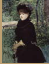
散歩、エドゥアール・マネ 1880年頃 東京富士美術館蔵